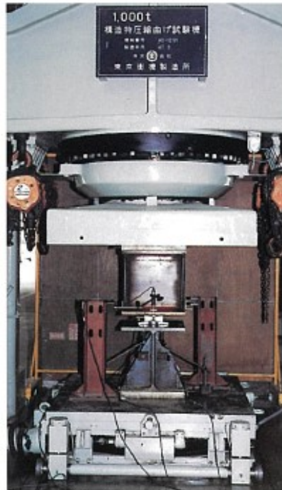
(財)日本建築総合試験所で試験